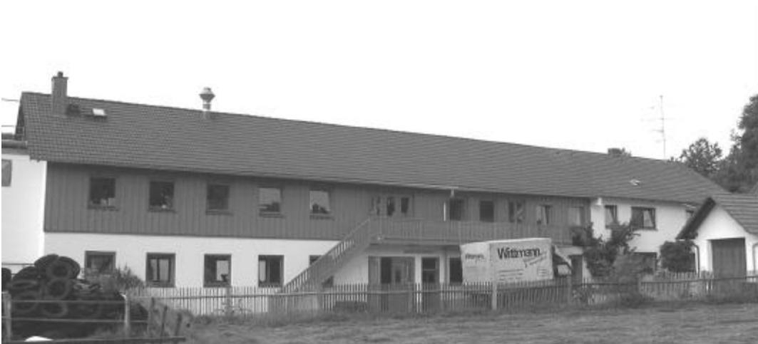
Schreinerei Wittmann ( bereits belegt )

Dienstleister: Solar GmbH Furth, Planung, Bau, Versicherung, Betrieb